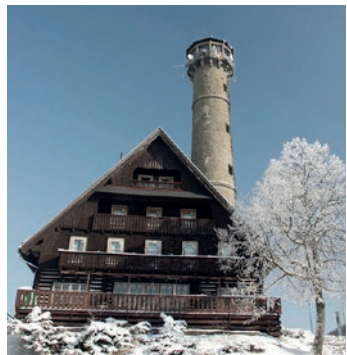
1 Svatobor rozhledna projekt i realizace 1934 chata projekt i realizace 1935