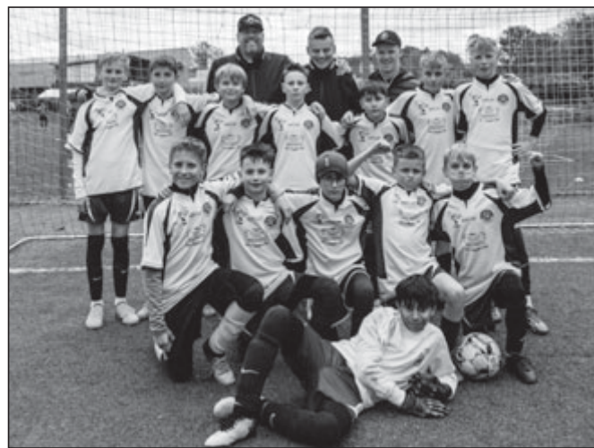
Úspěšný tým sušických žáků, kteří postoupili do semifinále turnaje hejtmána PK.

Potěšující jsou alespoň některé výsledky sušické mládeže. Dařilo se v žákovské kategorii. Úspěchem je cenný postup do semifinále poháru Hejtmána Plzeňského kraje. Su-