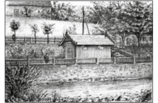
Zemský ústav pro chov lososů v Sušici.

Hledalo se tedy lepší místo, které se našlo na pravém břehu