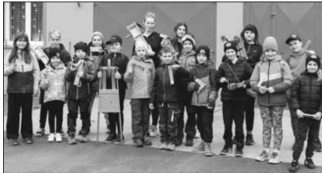
Děti ukázaly své nástroje při velikonočním hrkání ve Volšovech.