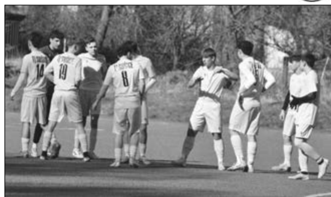
Dorostenci v domácím utkání proti spojenému týmu Hrádku a Horažďovic.

Remíza na domácí půdě se silným soupeřem je nakonec pro Sušici solidním výsledkem. „Bylo to asi nejlepší mužstvo, se kterým jsme hráli, z mého pohledu to byl