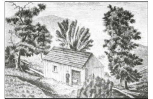
Líheň na prameni Kantůrce roku 1873.