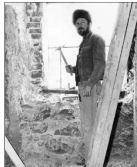
Pronajaté prostory šatlavu bylo třeba zrekonstruovat.