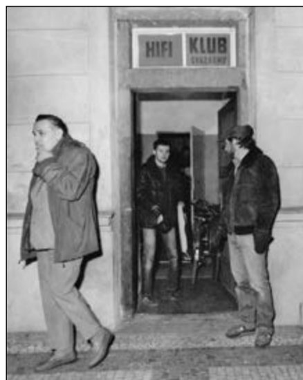
V bývalém Hi-Fi klubu dnes sídlí městská policie.