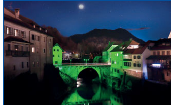
SL, Skofja Loka – Kapucinský most