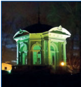
NL, Meerssen – Gloriëtté