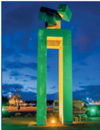
SE, Oxelösund – Stålhöten