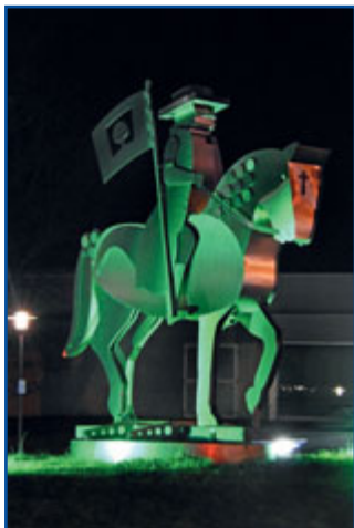
DE, Bad Kötzing – Pfingstreiter