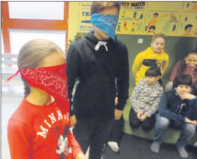
Pátáci si prošli zkouškou pěti lidských smyslů.