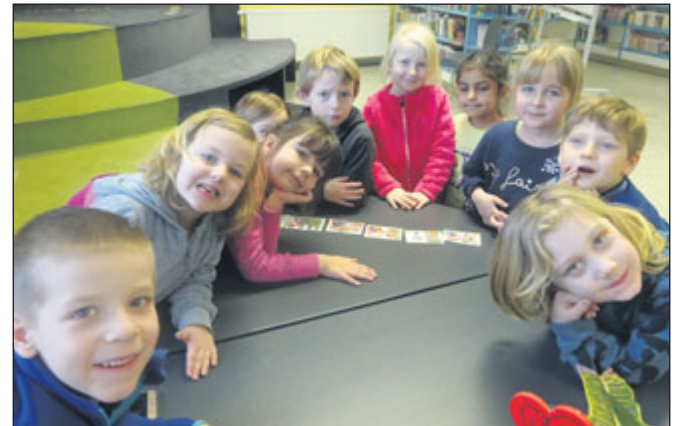
Děti MŠ se projely poznávacím knihovnickým expresem.