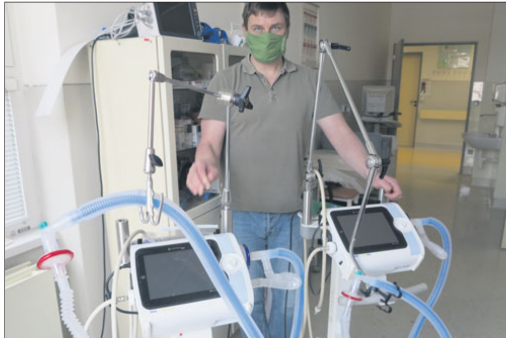
Nemocnice Sušice má k dispozici dva moderní transportní plicní ventilátory Monnal T60.

SUŠICKÁ NEMOCNICE V posledních měsících postihla celý svět včetně České republiky pandemie, kterou jsme do té doby viděli pouze v sci-fi filmech. Opatření, která stát zavedl, se dotkla i Sušice a samozřejmě i Sušické nemocnice. První schůze krizového štábu v nemocnici proběhla už koncem února. Výstupem z tohoto jednání bylo omezení návštěv na lůžkových odděleních a zákaz návštěv na jednotce intenzivní péče, zřízení bariérového vstupu u všech vchodů, zvýšení četnosti úklidu nebo zřízení izolační místnosti pro pacienty s podezřením na nákazu. Na další schůzce začátkem března jsme tato opatření ještě zpřísnili úplným zákazem návštěv, omezením vstupu pouze na hlavní vchod, který je otevřen pouze do 16 hodin, potom je otevírán recepce na zvonek. U vchodu do nemocnice jsme instalovali stůl, kde pracovník nemocnice kontroluje nošení ochranné roušky, dezinfekci rukou a měří přichozím teplotu. Jako záchranné stanoviště funguje již zmiňovaná izolační místnost. V neposlední řadě hlídáme i to, aby návštěvníci mezi sebou dodržovali bezpečnou