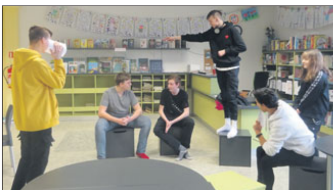
Devátáci obhajovali podstatu a důležitost knihoven.