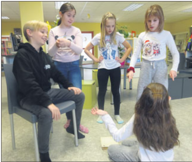
Čtvrtáci si na vlastní kůži prožili pověst z našeho regionu.