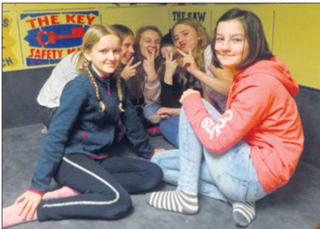
Šestáci se seznámili s postupem výroby knihy.