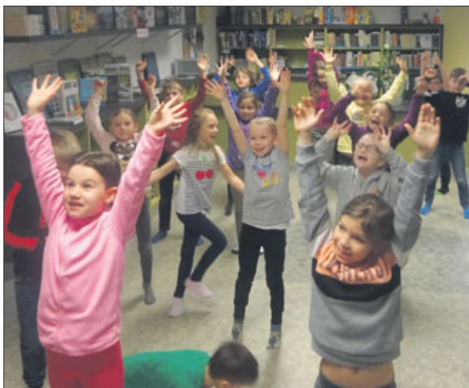
Prvnáčníci si přišli pohrát s písničky.