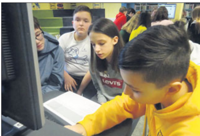
Osmáci se proškolili ve vyhledávání knih prostřednictvím webu.