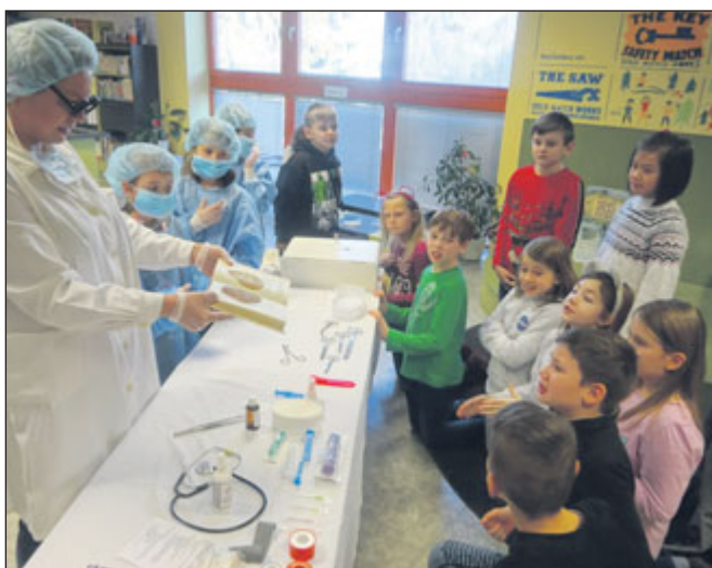
Třetíáci se formou Pitvy knihy seznámili s náležitostí knih.