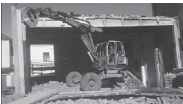
V současnosti probíhá plánovaná demolice nevyužívané kotelny ve Vodní ulici. Po odstranění stavby by plocha měla sloužit k parkování automobilů. ED

29. 3. 2021 – první kolo výběrového řízení: jeho součástí bude ústní pohovor, ze kterého budou vybráni kandidáti, kteří postoupí do druhého kola. Čas pohovoru bude upřesněn. Druhé kolo výběrového řízení: vybraní kandidáti budou absolvovat psychologické testy – datum bude upřesněno. Bližší informace obdržíte na služebně MP, e-mail: m.gregorova@mususice.cz, nebo na tel. 376 540 201 (Martina Gregorová).