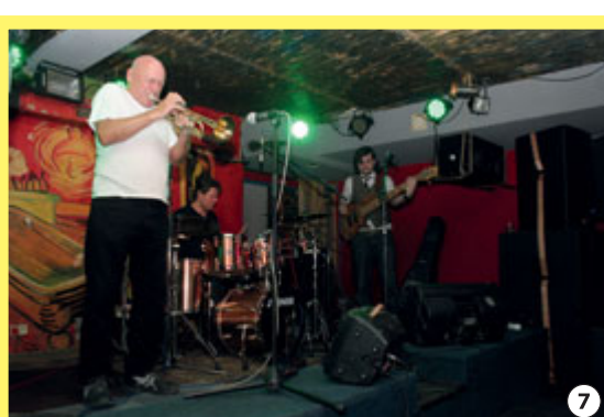
Laco Deczi s kapelou – Tradiční Kloub 9. 11. 2013 – jazz