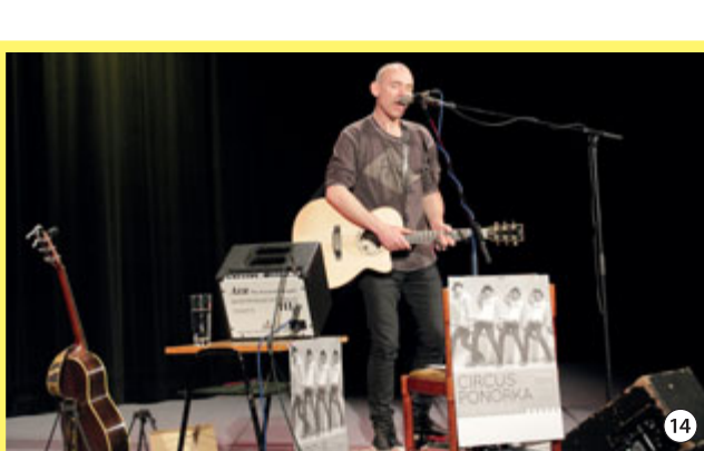
Circus Ponorka Kino Sušice 16. 4. 2014 – orchestr jednoho muže