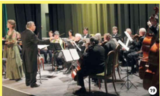
Pošumavská komorní filharmonie – Kino Sušice 6. 11. 2014