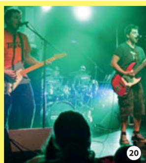
Wohnout – KD Sokolovna 15. 11. 14 – Laskonky a kremrole tour