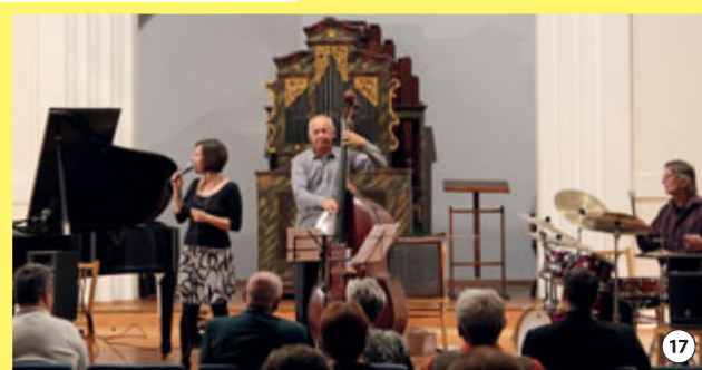
Jazz – Prague-Vienna-Connection – Smetanův sál 8. 10. 2014