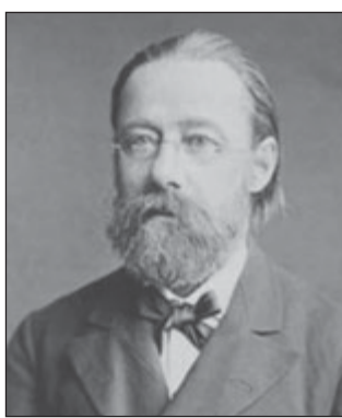
Bedřich Smetana (1824-1884)

Dvěte tohoto letního sídla byly vždy cestovateli otevřeny a mnohý čtenář řádků těchto asi s potěšením vzpomíná blahých chvil, jaké zažil v útulném přátelském kruhu v „Čeňkově pile“ na Hiršensteině. Jmenovitě hosté z Prahy téměř ruce si zde podávali a nejednou bylo tu i dosti hlučno a veselo.