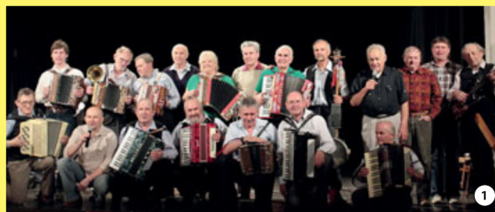
III. Sušické setkání harmonikářů – KD Sokolovna 21. 4. 2013