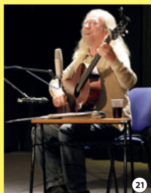
Jaroslav Hutka – Kino Sušice 25. 11. 2014