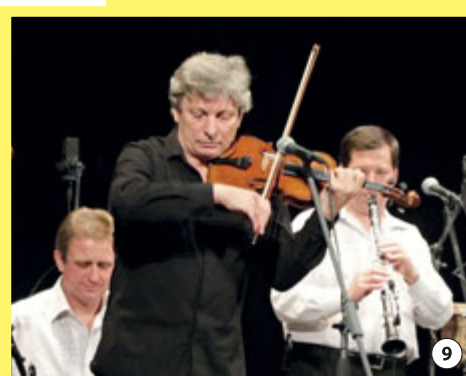
Hradišťan – KDS 26. 11. 2013 + Svatobor a SDS