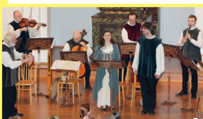
Musica Bohemica Smetanův sál 18. 12. 2014 – Vánoční písně a koledy

Do ticha se ponořil velký Tyršův sál sušické sokolovny. Osířelo jeviště i parket. Již téměř rok nemohou divadelní představení, koncerty ani plesy těšit návštěvníky. Stejně opuštěný zůstává i sál sušického kina a další centra kulturního a společenského