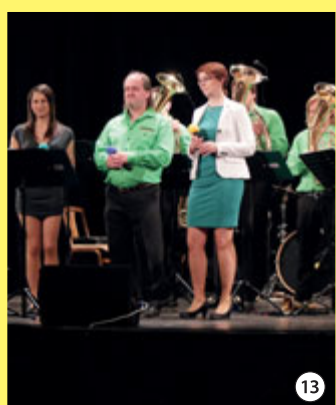
Libkovanka – KD Sokolovna 3. 4. 14