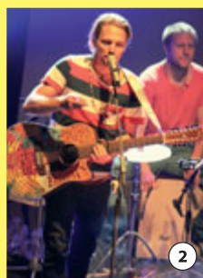
Tomáš Klus – KDS 23. 4. 2013