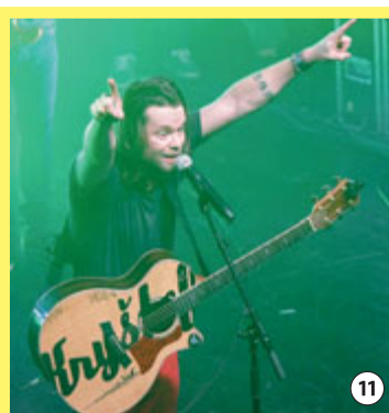
Kryštof – KDS 28. 2. 2014 – Inzerát tour