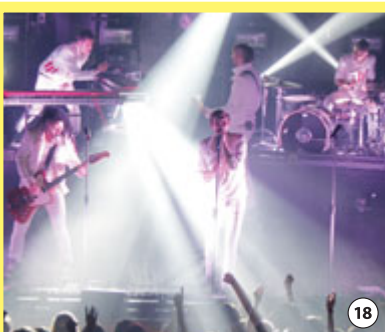
Mandrage – KDS 11. 10. 2014 – The Paranoid