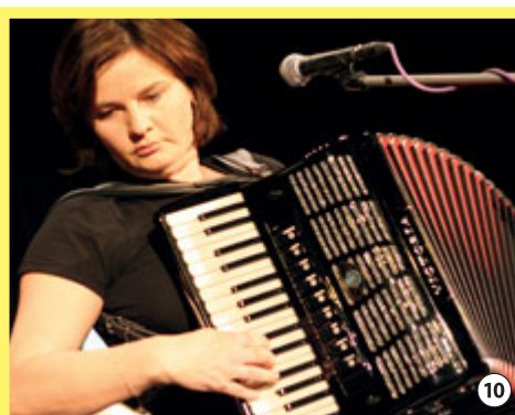
Radůza – Kino Sušice 4. 12. 2013 – koncert