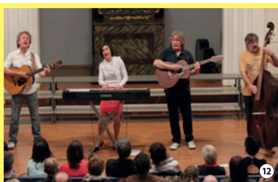
Nezmaři a Svatobor – Smetanův sál 21. 3. 14 – křest CD Stopy bláznů