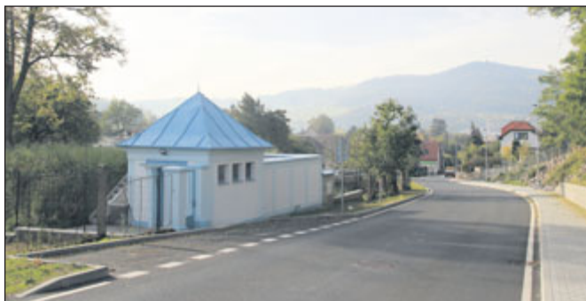
Rekonstrukce ulice Hájkova: před (dole) a současný stav (nahore) – viz str. 3