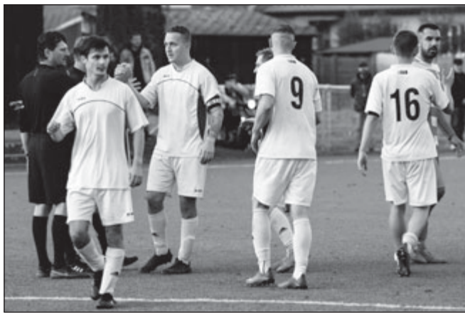
Béčko po domácím utkání proti Švihovu, které skončilo remízou 2:2.

„Bylo pro nás velmi důležité se na zápas dobře připravit a zvítězit. Kluci se před utkáním nahecovali díky našemu gólmánovi Fandovi Míčkovi, který slíbil týmu odměnu za to, že neinkasuje branku. To nás zřejmě nakoplo k nejlepšímu výkonu podzimní části.“