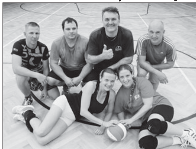
Sušickou volejbalovou soutěž ovládl tým Ďáblíci Dlouhá Ves.

Zvolený systém každý s každým je sice nejspravedlivějším, za to však nejnáročnějším, proto se v závěru celodenního klání ke slovu dosta-