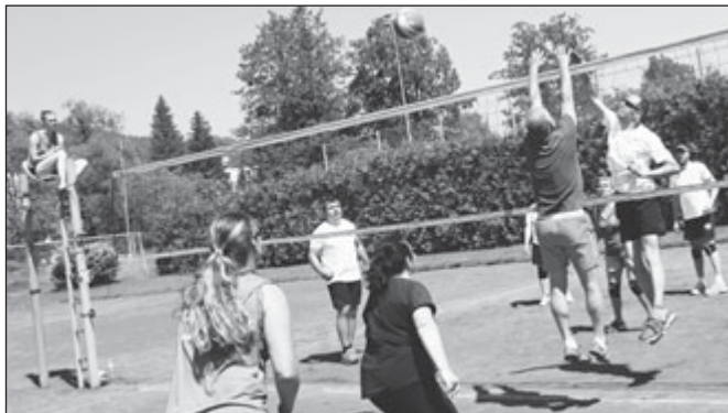
Zápas velhartických Klíšťat s Dáblíky, kteří pak postoupili do 1. ligy.

trpělivou prací vyzráli v nefalšované Dáblí.