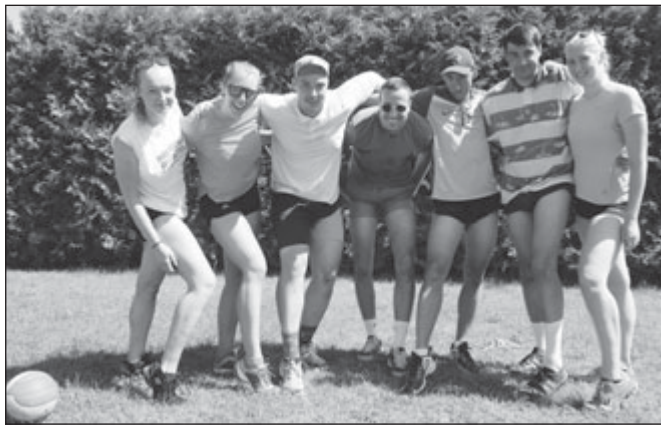
Sušický Vrtulník na kurtech dominoval a ovládl 1. kolo SUVOSO

Ani to však zkušené volejbalisty z klidu nevyvedlo. Naopak, pod deštěm se necelec hodinku lebedili, že záhlavka vyprahlých kurtů přišla jako na zavolanou. Třetí a poslední ořes však poznamenal nejdříve hráče: Tým K2 a zejména pak mnoha vavříny ověnění Dřevaři spadli do druhé ligy a Kolinec s Dáblíky naproti tomu postoupil do elitní skupiny. Takové zemětřesení nikdo nečekal, i když... dřevařský kapitán pauzuje už delší dobu a jeho mančaft se nesešel v plném počtu, za to Dáblíci postupem let