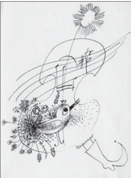
Jedna z kreseb sbormistra Josefa Baierla

Jeho zásluhou vznikl v Sušici také festival „Je kraj, kde voní tráva“ 17.–19. 10. 1996 a pak každé dva roky vždy na jaře. Stal se tradicí, která trvá dodnes. I letos se měl uskutečnit již 13. ročník festivalu, ale musel být kvůli koronaviru odložen na příští rok 2021. A. Fišerová (pokračování příště)