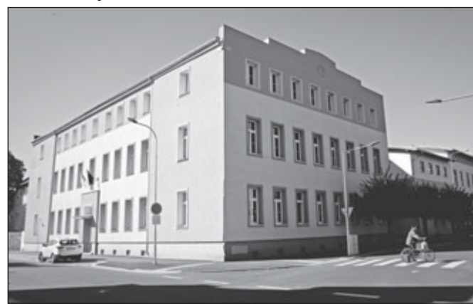
Dnes sídlí Základní umělecká škola v této zrekonstruované budově.

Činnost Sušického dětského sboru byla a je velmi bohatá a různorodá, uvedu např. rok 2001–2002: březen 2001 – Broučci (přehlídka v Klatovech), Včelky (Muzikparty Kötzing, Jarní koncerty SDS a hostů (Javoříčky a Jitřičko) duben – Sluníčka (soutěž v Písku – stříbrné