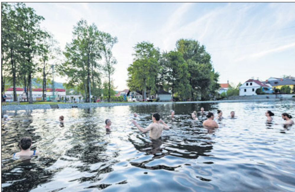
Workshop Hluboký ponor