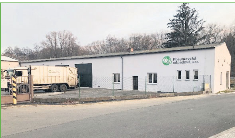
Nové zázemí v Sušici v ul. Nová – po prvotní rekonstrukci

Společnost byla založena 26. 10. 2015 městy Klatovy