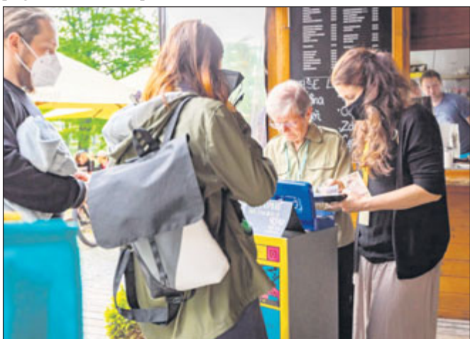
Příchod hostů projekce

Velký dík letos proto patří především divákům, bez kterých by to nešlo. Na projekce chodilo přes 20 lidí, což zce-