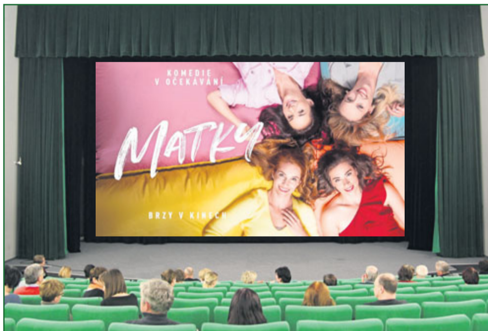
Sušické kino chystá pro diváky mnoho slibných premiér.

„Kino Sušice je stejně jako všechna ostatní kina v ČR specifické a unikátní. V celkové roční návštěvnosti z přibližně 320 digitálních kin u nás se držíme už několik let kolem 95 příčky. Jedná se však o všechna digitální kina, tedy i multiplexy a vícesálová kina ve velkých městech. V případě, že bychom se zaměřili na roční návštěvnost kin, která jsou stejně jako my na malém městě (8–12 tisíc obyvatel) a mají pouze jeden sál, tak se rázem vyhoupneme na přední pozice, dokonce i na ty medailové. Důvodů, proč tomu tak je několik. Především je to přízní vás diváků a pak také tím, že se nacházíme v turistické oblasti. Léto bývá obvykle v kinech „okurkovou sezónou“, vychází málo zajímavých premiér a teplé a slunné počasí zve spíš do přírody, než do kina. Proto návštěvnost výrazně klesá. Zde v Sušici tomu není jinak, ovšem pokles diváků není tak výrazný, protože si