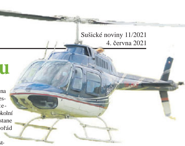
Text a foto Euard Liskovec

le, pohled na město přesně vsazené mezi okolní kopce zůstane jistě napořád v paměti všech účastníků.