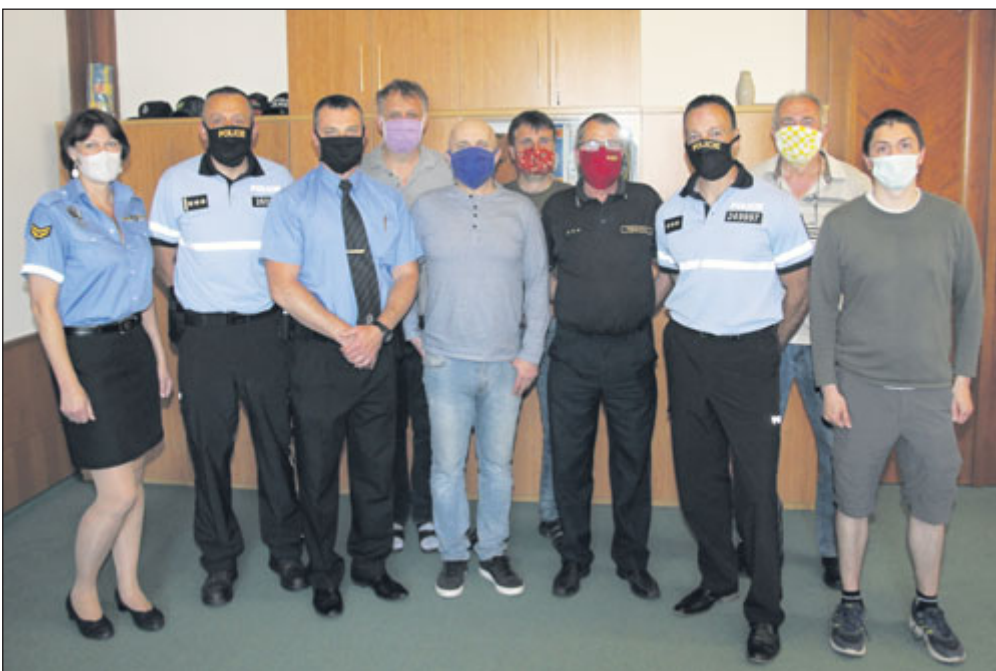
Krizový štáb ORP Sušice na radnici před posledním jednáním.

státem, krajem a ORP. Z rozpočtu ORP byly nakoupeny ochranné prostředky za cca 720 tisíc korun. Městu hodně pomohly firmy, které věnovaly městu ochranné pomůcky za 502 tisíc korun a jednotlivci, kteří pomohli jinak. Jejich seznam je uveden na stránkách města.