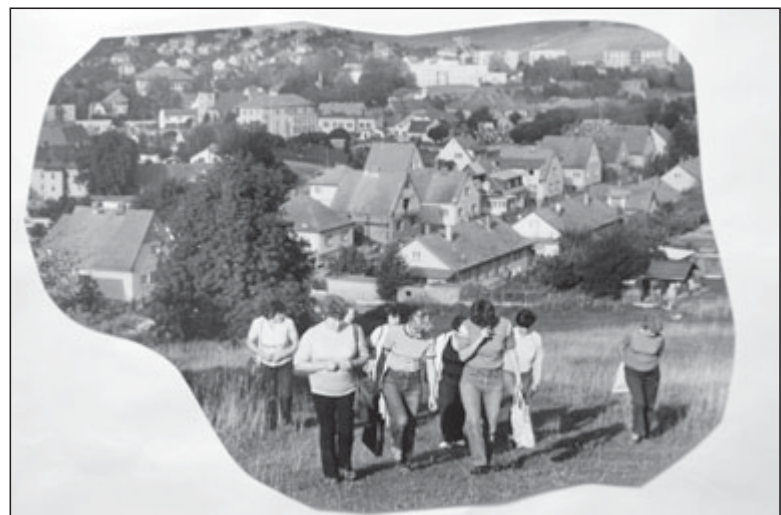
Na výlety jsme vyráželi i rovnou ze Sušice.