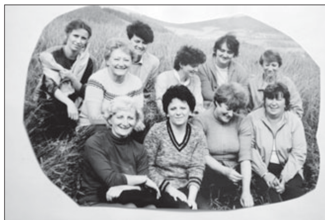
Foto z výletu, které jsme podnikaly i v okolí Sušice.